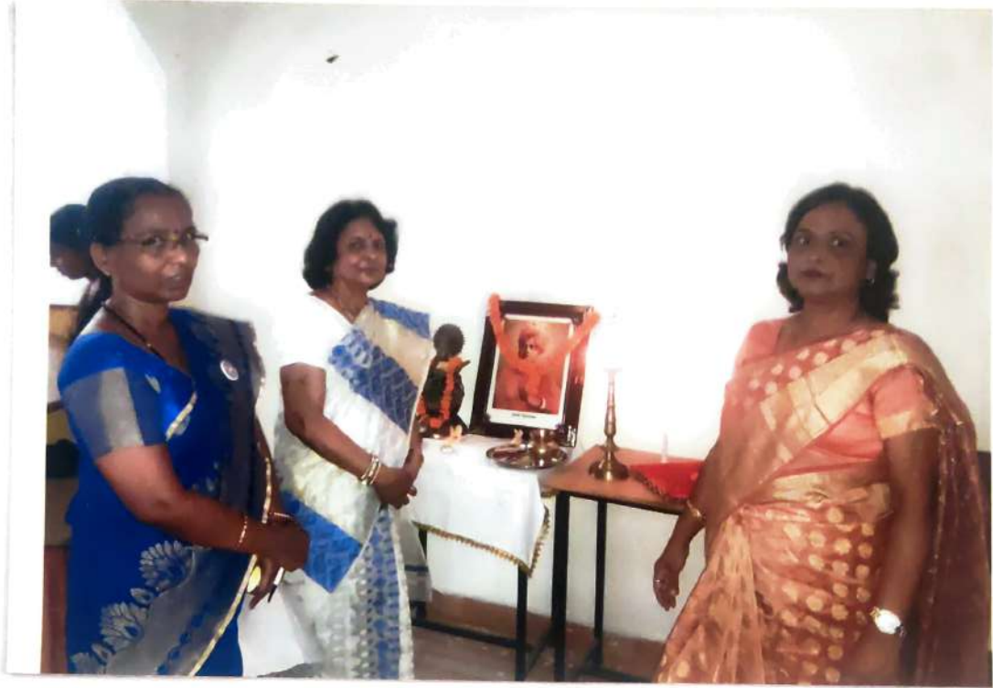
P.! PRINCIPAL Govt. Mata Shabari Naveen Girls P/G College, Bilaspur (C.G.)