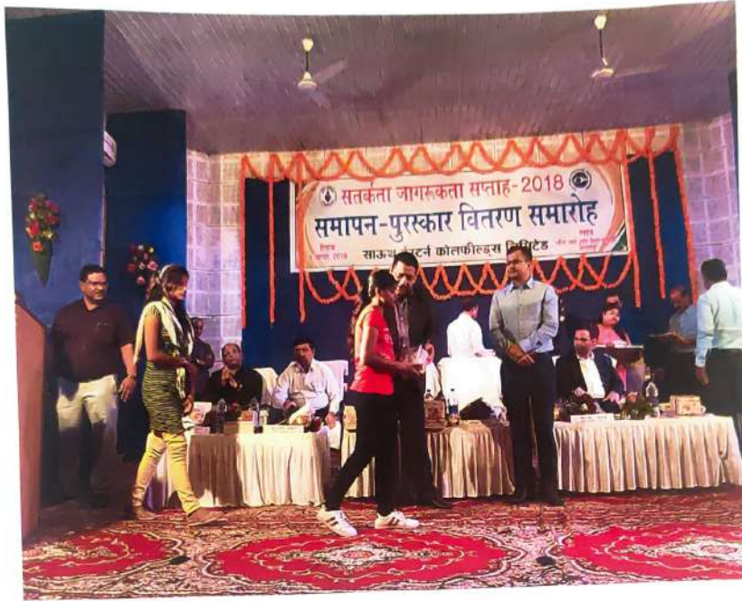
Felicitation by CMD, S.E.C.L